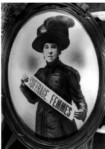
Hubertine AUBERT (1848-1914)

Les historien(ne)s utilisent la métaphore des vagues pour caractériser l'évolution des mouvements féministes depuis la fin du XIXème siècle avec des périodes d'essor où la vague s'épanouit et des périodes de recul où on est au creux de la vague.